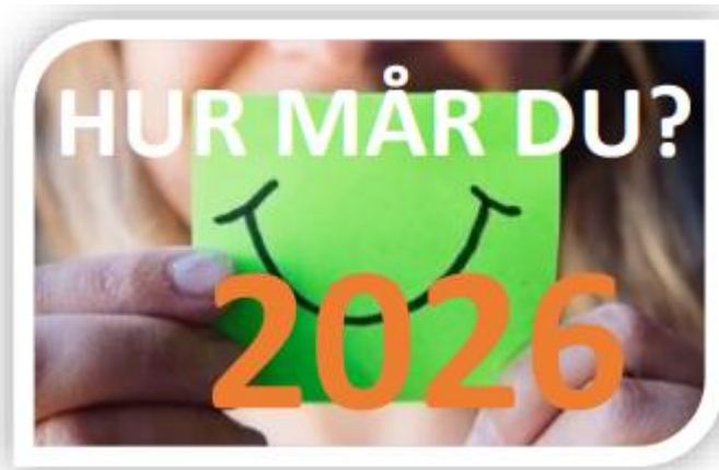
Figur 1 Logotyp från Borås folkhögskola om "hur mår du".

Övriga aktiviteter med verksamhetsområde inom Sjuhärad har varit "Rollspel 101", med Studieförbundet Göteborg – Sjuhärad samt "Att motverka ofrivillig ensamhet genom broderikonst" med NBV Väst (VGB, 2025).