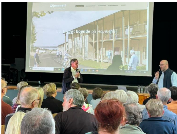
Seminariet lockade många intresserade. Det bjöds på intressanta föredrag om att Bo tillsammans på många platser runt om i Sverige. Både om fördelar och problem.